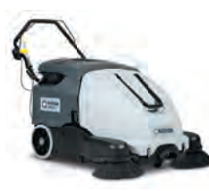
SW900 İster akülü ister benzinli süpürme