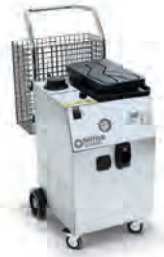
SDV8000 Deterjan, vakum ve buhar bir arada