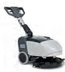
SC351 Küçük alanların büyük makinesi