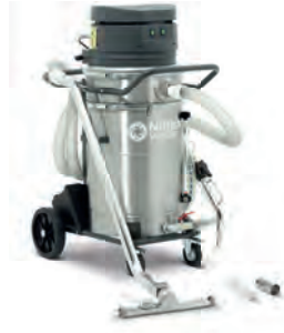
VHO200 Sıvılar / Metal Yağ