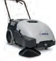
SW 750 Sessiz ve kolay temizlik