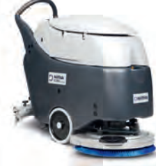
SC450 Ekonomik, dayanıklı ve kullanımı kolay