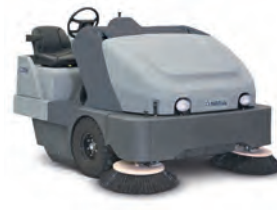
SR 1601 İnce tozlar için endüstriyel çözüm