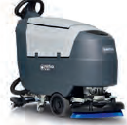
SC401 Ekonomik, kullanımı kolay küçük ve özellikli