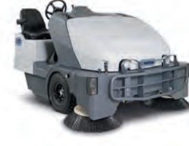
SW8000 Geniş alanların süpürülmesi için ideal. Suyla toz kontrolü özelliği