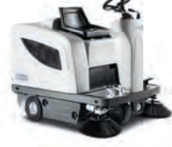
SR 1101 Etkili süpürme, düşük işletme gideri