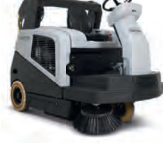
SW5500 Endüstriyel temizlikte hybrid teknolojisi