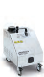
SO4500 Sadece buhar ile yapılan temizlikte ideal