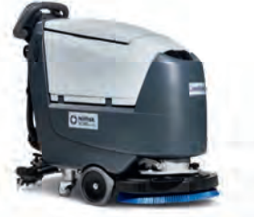
SC500 Dünyanın, suyu en verimli kullanan makinesi