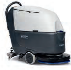
SC530 B/SC530 BD Sürüş motorlu veya sürüş motorsuz, tercih sizin!