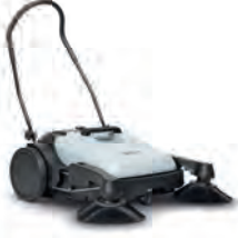
SW 200/SW 250 Elle süpürmede kolaylık