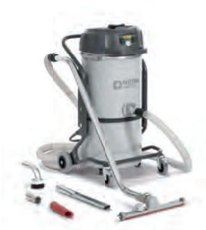
VHS120 Genel Temizlik / İnşaat Yapı / Fırın / Metal Talaş