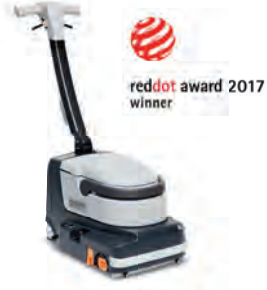
SC250 En dip köşeleri bile tek geçişte süpürür, yıkar ve kurutur