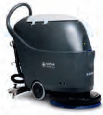
SC430 B Kullanımı basit güven veren temizlik performansı