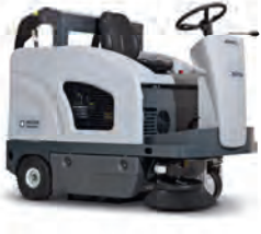
SW4000 Mükemmel performans ile daha az toz