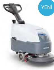
SC370 Sıkışık dar alanlarda zemin temizliği