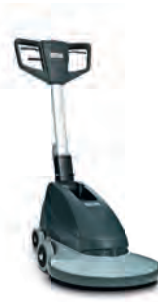
BU500 Geniş alanlarda parlak yüzeyler için