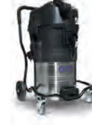
IVB7X - ATEX