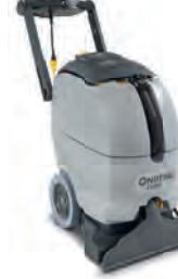
ES300 Geniş halıların temizliği artık çok kolay