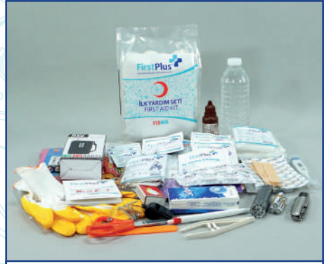
FP10.105 Deprem - Afet Ekstra İçerik Paketi