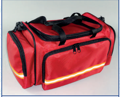
KM122 Paramedik Orta Boy Çanta