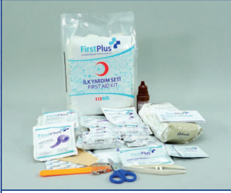
FP10.101 Ev Mega İçerik Paketi