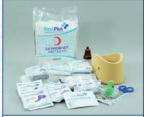
FP10.102 Araç İçerik Paketi