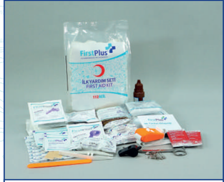
FP10.104 Doğa Sporları Mega İçerik Paketi