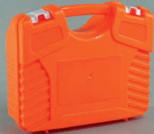
PL118 Plastik İlk Yardım Çantası