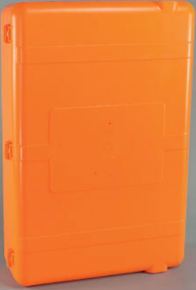
PL114 Plastik İlk Yardım Dolabı