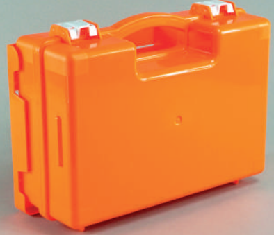
PL106 Plastik İlk Yardım Çantası