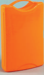
PL117 Plastik İlk Yardım Çantası