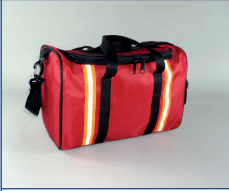
KM127 Paramedik Küçük Boy Çanta