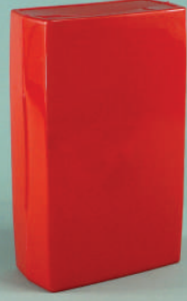
PL101 Plastik İlk Yardım Çantası