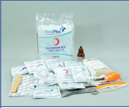
FP10.103 İş Yeri Ekstra İçerik Paketi